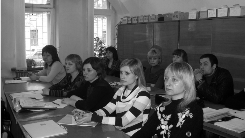
Учасники семінару – начальники архівних відділів РДА та міськрад області

6 та 9 квітня 2010 року , у рамках проведення щорічного Всеукраїнського конкурсу «Кращий державний службовець», в держархіві області відбувся I тур зазначеного конкурсу, в якому взяли участь три держслужбовці архіву.