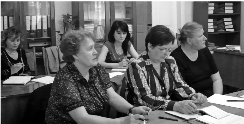
Учасники семінару – відповідальні за архівні підрозділи податкової служби м. Харків