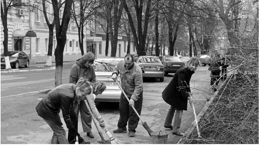
Працівники ДАХО прибирають земельну ділянку біля будівлі архіву на вул. Мироносицькій, 41

всі вікна фасаду будинку ДАХО по пр. Московський, 7. В архівосховищах будівлі архіву по вул. Мироносицькій, 41 знепилено: 2600 пог. метрів полиць, 7881 архівних коробок та 1000 в'язок архівних справ.