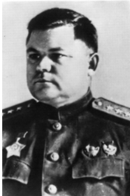
Ватутін Микола Федорович

При підготовці операції командування фронтів забезпечило переваги на ділянках прориву ворожої оборони в артилерії, танках, літаках і людських резервах. Наступ розпочався в районі сіл Томаківка і Борисівка, у результаті яких 5 серпня 1943 р. було звільнено м. Белгород. Відразу ж розпочалося просування