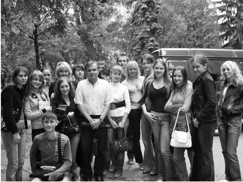
1-й набор документоведов (2006 г.) после 1-ой экскурсии в Госархиве Харьковской области

весь пятилетний цикл практики теперь возможно проходить в госархиве области, что позволяет студентам значительно глубже освоить специальность и более основательно подготовиться к написанию дипломной работы.