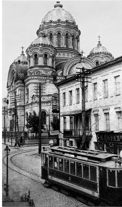
«Пекельне заокруглення» біля Миколаївського собору