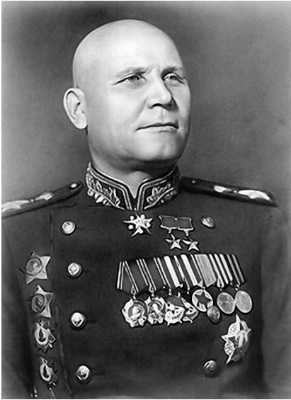
Конєв Іван Степанович

військ Воронежського фронту до Харкова, і 11 серпня 1943 р. було перерізано залізничну колію Харків-Полтава в районі ст. Ковяги. Намагаючись зупинити наступ, противник перекинув із Донбасу 4 танкові дивізії, які вдалися до контратак проти 40-ї і 27-ї радянських армій і 1-ї танкової армії у районі міст Охтирка і Богодухів.