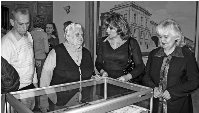
Одноденна виставка архівних документів «Харків та Харківський університет за часів громадянської війни та реорганізації освіти» у приміщенні музею історії ХНУ ім. В. Н. Каразіна